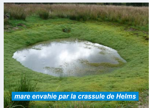
mare envahie par la crassule de Helms